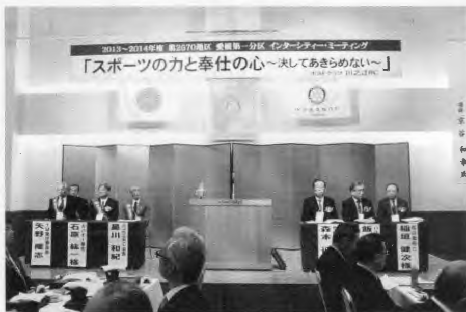
2014/2/22 愛媛第1分区 インタシティー・ミーティング