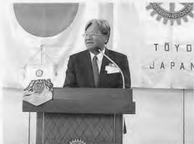
各クラブ 訪問 ～クラブ協議会～