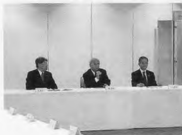
2013/12/3 愛媛第1分区 現・次期会長幹事懇談会