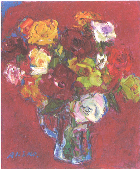
「バラ」 油彩 谷 晶子