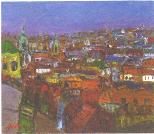
「ザルツブルクにて」 油彩 谷 晶子