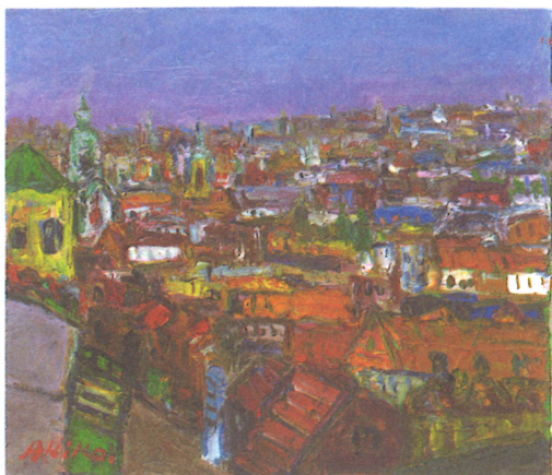
「ザルツブルクにて」 油彩 谷 晶子