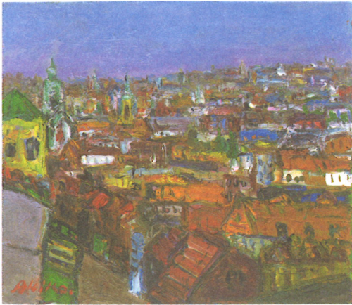
「ザルトツブルクにて」 油彩 谷 晶子