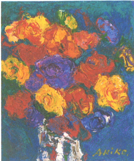
「花」 油彩 谷 晶子