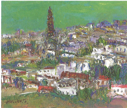
白いやまなみ-モントロ 油彩 谷 晶子