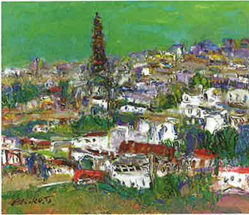
白いやまなみ - モントロ 油彩 谷 晶子